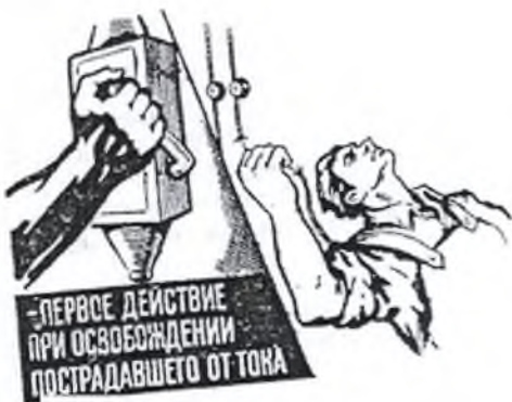
Рис. 1. Освобождение пострадавшего от действия электротока путем отключения электроустановки

6.1. Быстрое отключение от действия электрического тока это первое действие для спасения пострадавшего.