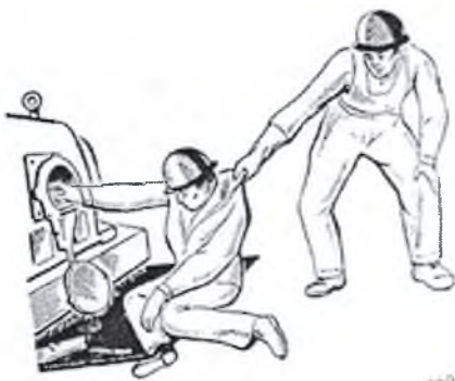
Рис. 3. Освобождение пострадавшего от действия части, находящейся под напряжением до 1000 В