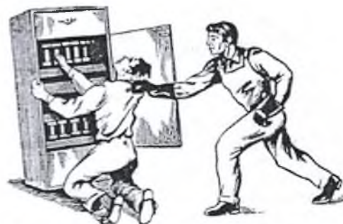
Рис. 4. Освобождение пострадавшего от токоведущей электрического тока

6.2. При поражении электрическим током необходимо быстро освободить пострадавшего от действия тока - немедленно отключить ту часть электроустановки, которой касается пострадавший (рис. 1). Когда невозможно отключить электроустановку, следует принять иные меры по освобождению пострадавшего, соблюдая надлежащую предосторожность