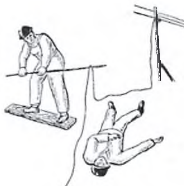
Рис. 2. Средства личной защиты при освобождении от действия электрического тока в электроустановках напряжением до 1000 В